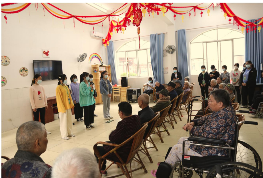
志愿者为颐养院老人表演节目