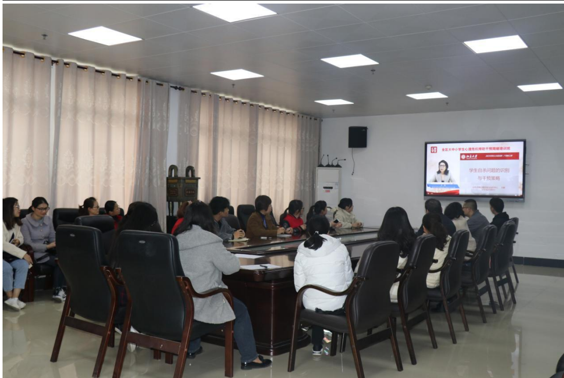
教师参加学生心理危机识别技能和干预策略集体备课会