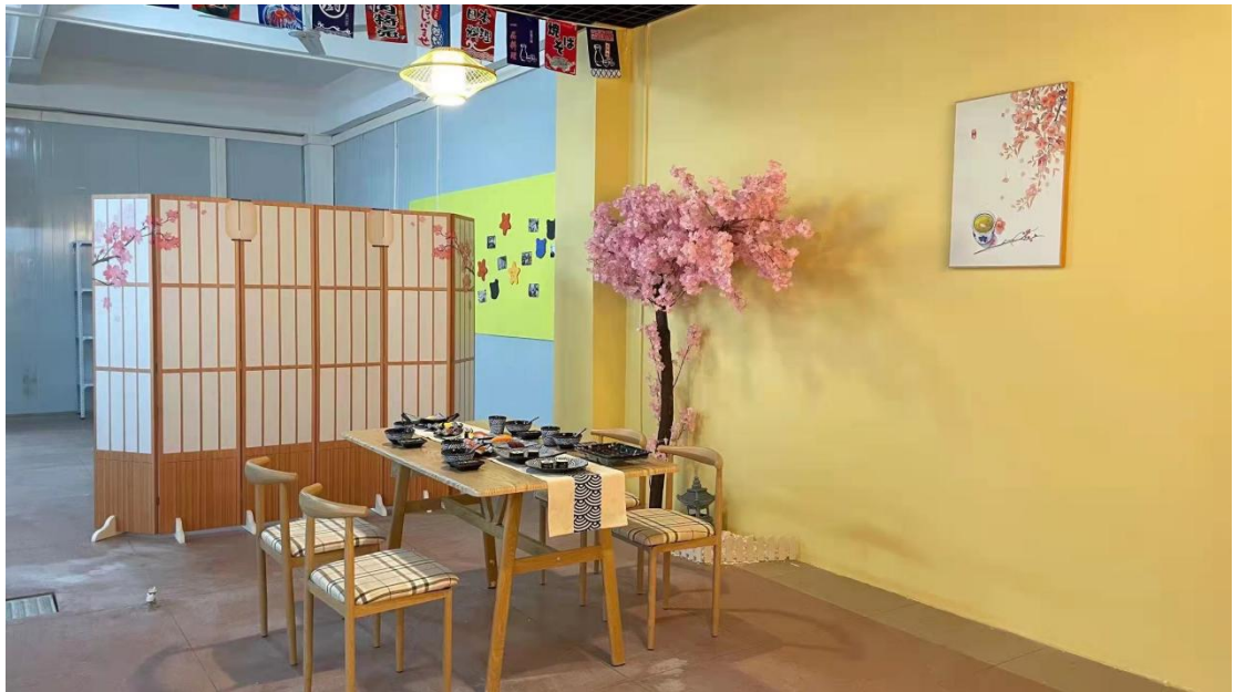
校企共建日本料理实训室（三）