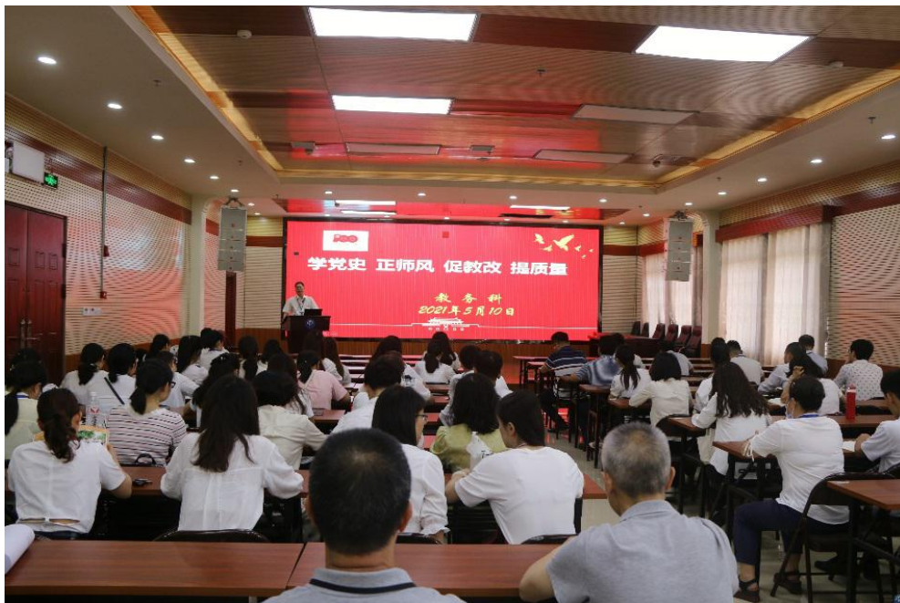
“学党史 正师风 促教改 提质量”专题讲座