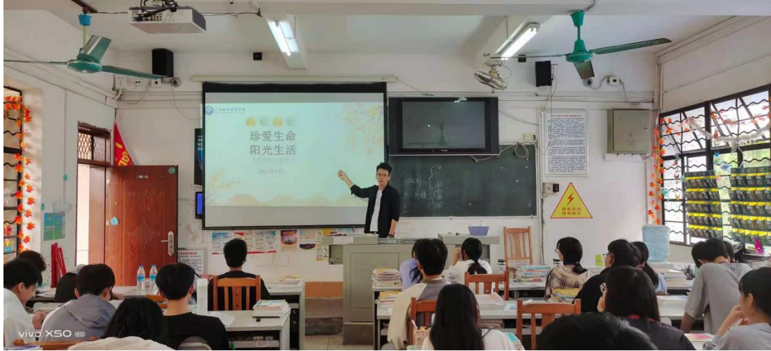
班级开展生命教育主题活动照片