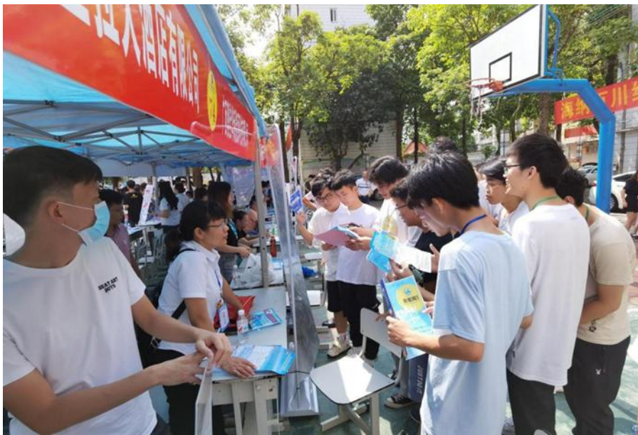
2021 年毕业生校园招聘会现场

在篮球场成功举办。此次校园招聘会共有 89 家用人单位参与，提供岗位 4050 个。我校共有 1144 名毕业生参加，投递简历 1700 余份。据统计，初步达成就业意向的有 851 人。有效供需比达到 1:3。