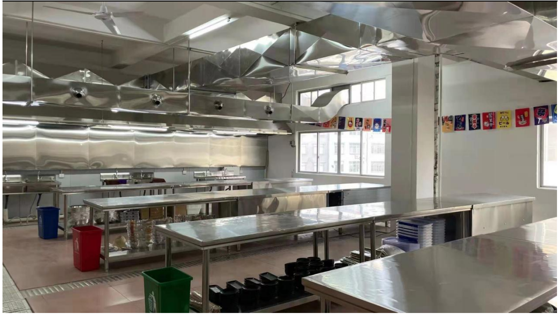
校企共建日本料理实训室（二）