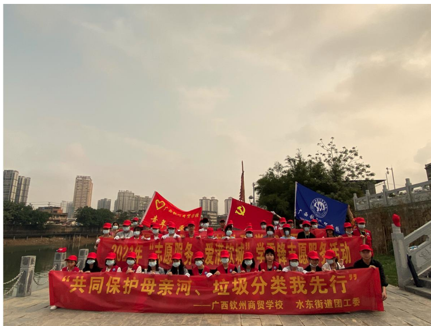
志愿者来到钦江开展“共同保护母亲河 垃圾分类我先行”志愿服务活动

2. 学校领导认真学习自治区党委、政府和钦州市委、政府的相关扶贫方针政策，积极助力乡村振兴战略，定期深入帮扶村开展实地调研、乡村清洁等，按相关要求认真做好定点帮扶工作。