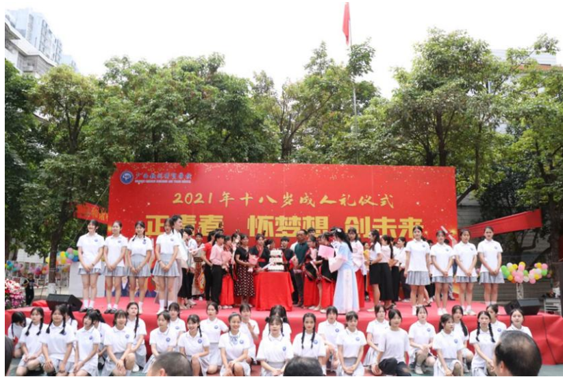
2021年十八岁成人礼仪式

的校园文化生活。并充分利用校园广播站、校园信息网等各种宣传媒体，及时报道校园新事、好事，大力宣传国家方针政策及社会主义核心价值观，抑制歪风邪气，树立正确的舆论，正面激发学生向上的动力，促进良好学风、校风的养成，形成正确的校园道德舆论。