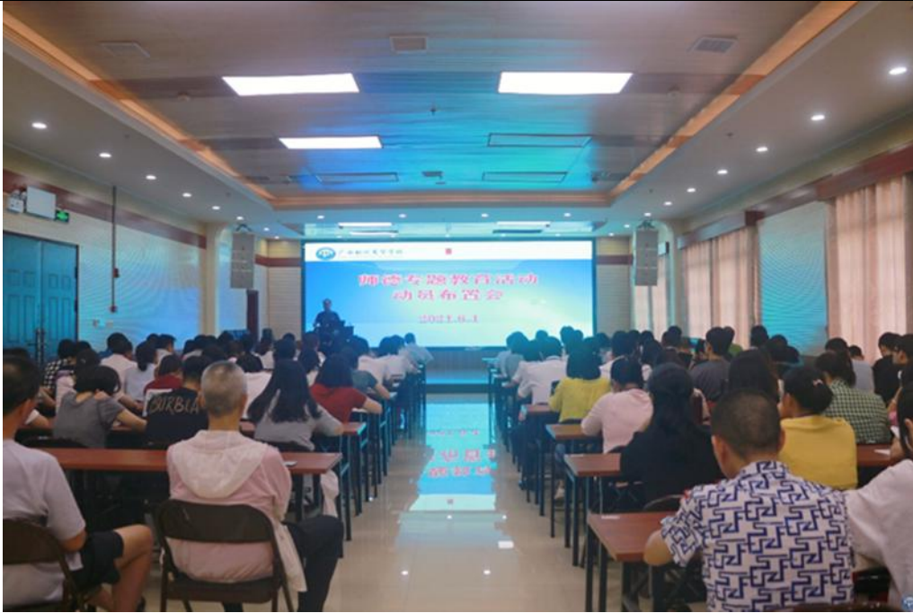
师德专题教育活动动员布置会