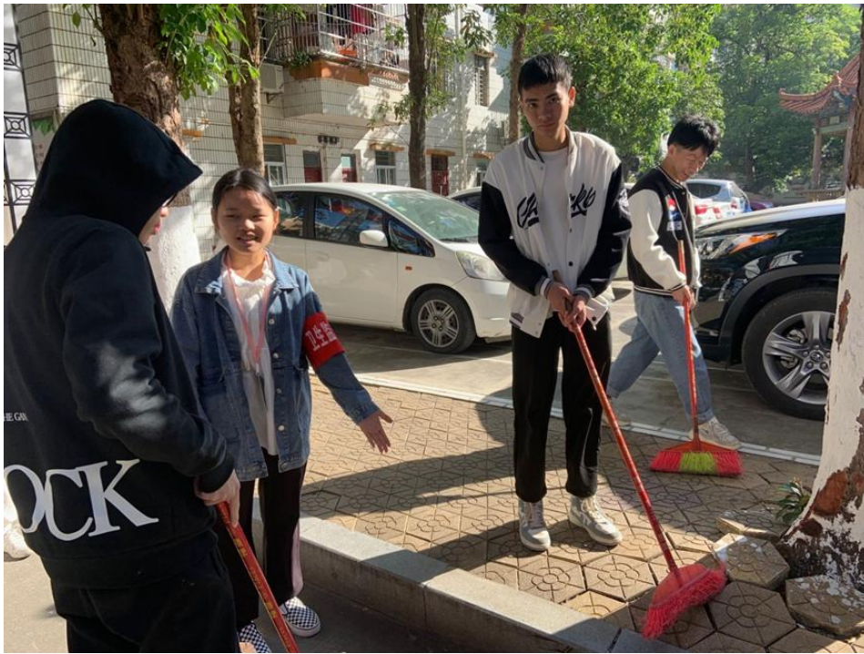
卫生监督小组成员监督值周班级扫地