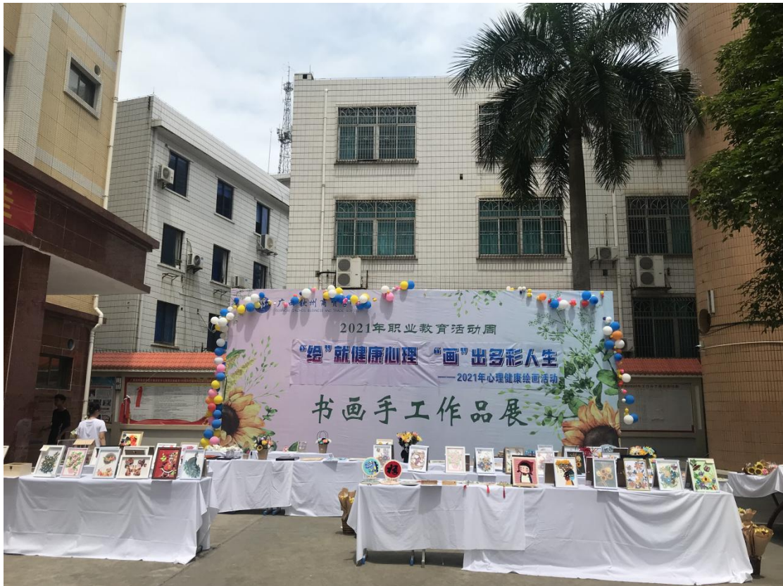
“绘”就健康心理，“画”出多彩人生——2021年心理健康绘画主题活动